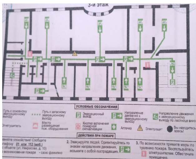
План эвакуации – 3 этаж: